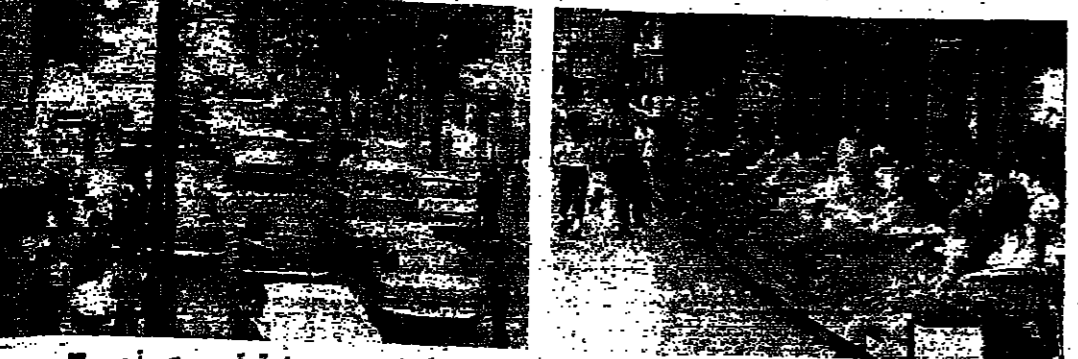
مقاهي الرصيفة بالحراء لاحتضانها الرواد حركة السر بيت عملية في بيروت أمس